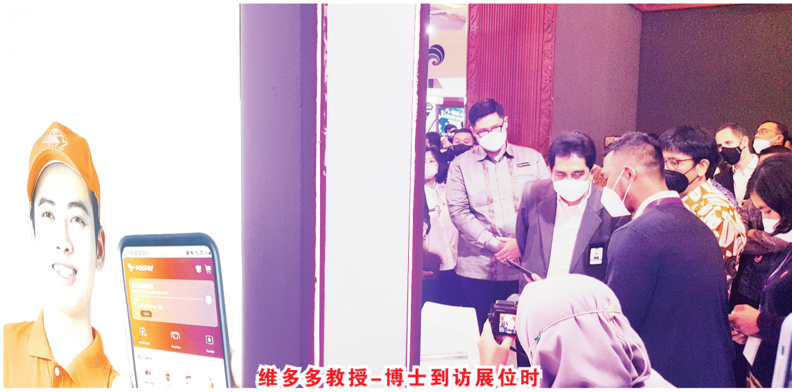
维多多教授-博士到访展位时