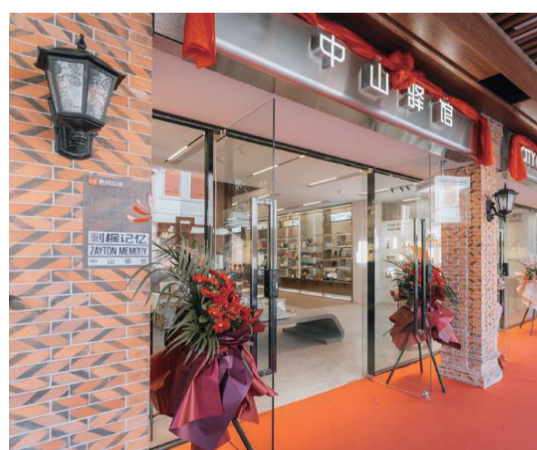
中山驛館位於中山中路37、39號