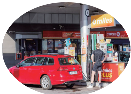
新華社北京8月1日電 為幫助打擊有組織

織犯罪，瑞典從8月1日起禁止匿名購買預付費手機SIM卡，如需購買、入網使用預付費手機卡，則必須實名登記包括使用者姓名和個人身份號碼在內的信息。