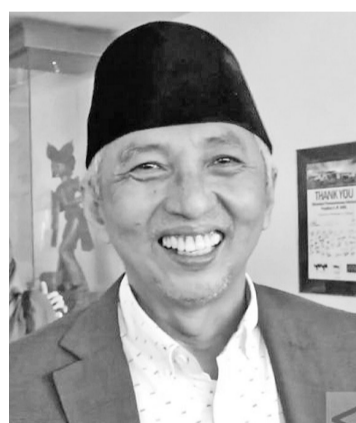
我国驻马来西亚大使 荷尔莫诺(Hermono)

【本报讯】据安达拉通讯社周四(28/7)报道，我国驻马来西亚大使荷尔莫诺(Hermono)表示，政府从今年8月1日起，重新开放所有行业的印尼移工到马来西亚工作。周四(28/7)上午，劳工部长伊达与马来西亚人力资源部长沙拉凡(M Saravanan)签署了一份联合声明，签署关于在马来西亚的国内安置与保护印尼移工的谅解备忘录。荷尔莫诺表示，联合声明中包括决定从8月1日开始向马来西亚重新开放所有行业的印尼移工。重新开始安置印尼移工，是因为马来西亚政府已承诺认真执行关于在马来西亚国内部门