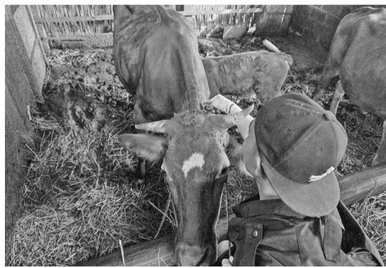
【本报讯】处理口蹄疫专家小组协调员威酷(Wiku Adisasmito)日前表示，根

据截至周二(26/7)收集的数据，我国已有22个省区受到口蹄疫病毒的感染。威酷当天在《处理口蹄疫的发展》相关的新闻发布会上指出，好消息是，这个数字并没有比上周增加。这意味着在过去的一周里，我们已