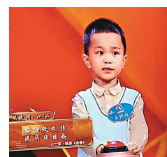
◆詩詞大會現場，其中之一參賽者！

玩飛花令要有急智，其難在考驗個人的記憶力和詩詞修養，要求能迅速根據關鍵字詞，在腦中搜索出相關詩句。兼又考驗個人的隨機應變能力，堪稱記憶和智慧的交鋒。此遊戲把詩詞融入其中，活學活用，有助大眾了解中國詩詞文化，願跨越古今時間長河，多親近經典詩詞！