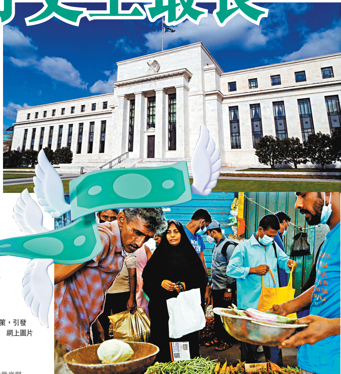
◆ 多個新興市場通脹高企，陷入嚴重經濟危機，圖為斯里蘭卡一個市集。

國際金融協會的數據顯示，7月份海外投資者對新興市場股票和債券的跨境流出金額達到105億美元，過去5個月的總流出金額超過380億美元，創下2005年有紀錄以來的最長淨流出時間。國際貨幣基金組織(IMF)日前亦警告，當前在亞洲新興市場(不包括中國)中，資本流出情況與2013年相當，當時因聯儲局暗示將比預期更早地縮減買債規模，導致全球債息大幅上升。