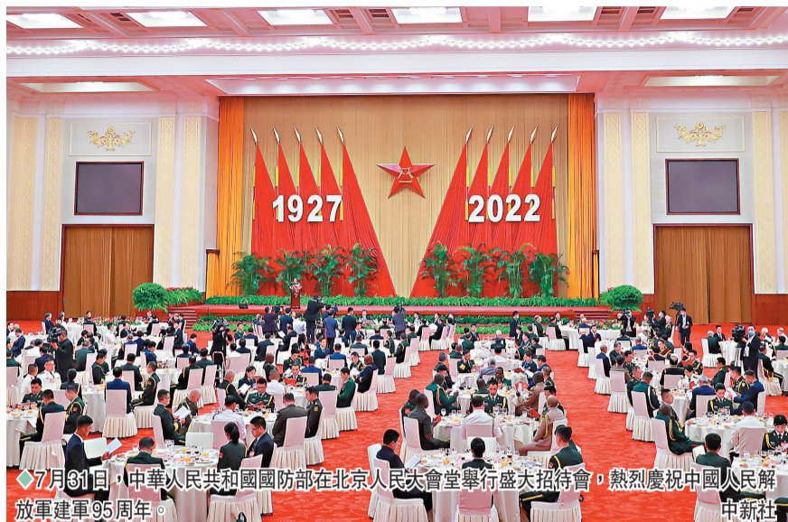
7月31日，中華人民共和國國防部在北京人民大會堂舉行盛大招待會，熱烈慶祝中國人民解放軍建軍95周年。

出席招待會的還有中央和國家機關有關部門、有關人民團體和北京市負責同志，以及軍委機關各部門、解放軍駐京各大單位、武警部隊負責同志；軍隊離退休老幹部代表，「八一勳章」獲得者、全軍英雄模範、首都民兵、烈軍屬、全國雙擁模範、原國民黨起義人員代表以及外國駐華武官等。