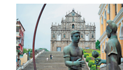
澳門2日起容許重開娛樂場所及恢復堂食。

澳門第14輪全核核酸檢測已經結束，逾70萬人次採樣，全部結果都呈陰性。行政長官1日頒布批示，自2022年8月2日起，解除關閉美容院、健身房、酒吧等場所以及餐飲場所不能堂食的措施。人員外出需佩戴口罩及在餐飲場所進食需出示三天內核酸採樣證明等要求。