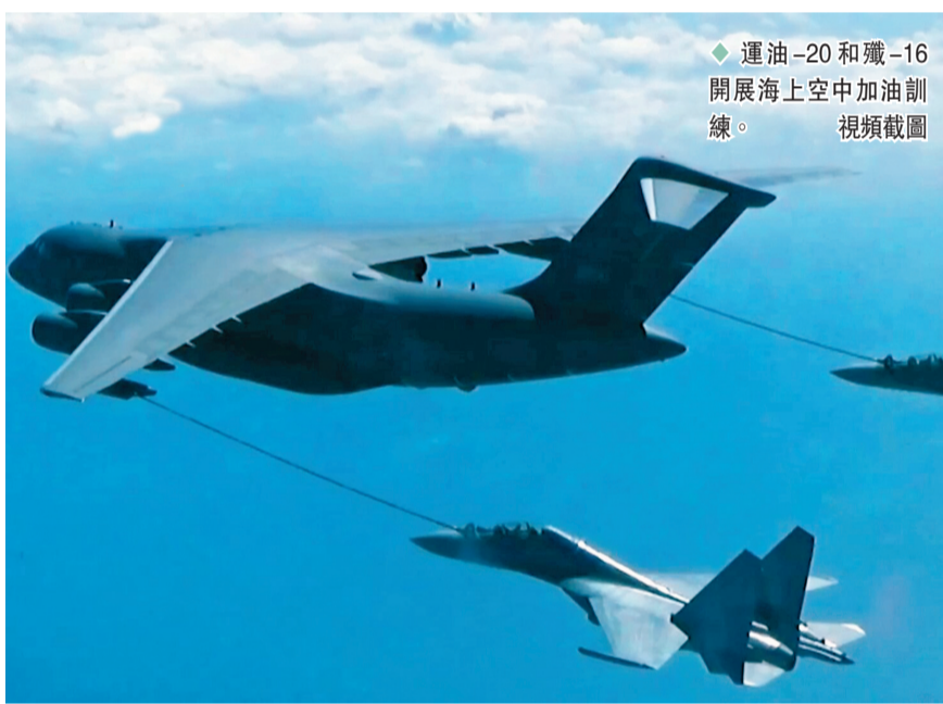
運油-20和殲-16開展海上空中加油訓練。視頻截圖

知名軍事專家、鳳凰衛視評論員宋忠平向香港文匯報表示，空軍多型戰機繞飛祖國寶島已經釋放了強烈備戰的信號，這也警告佩洛西千萬不要窺訪台灣，如果她一意孤行窺訪台灣的話，將會引發十分嚴重的後果，相信解放軍將會以自己的行動作出證明。宋忠平特別指出，空軍繞島巡航中出動了加油機，表明解放軍戰機的持續滯留時間、作戰能力、續航能力、戰鬥力都大大提升，這同時也釋放出強烈信號，顯示出解放軍對台軍事準備的嚴密性與充分性。