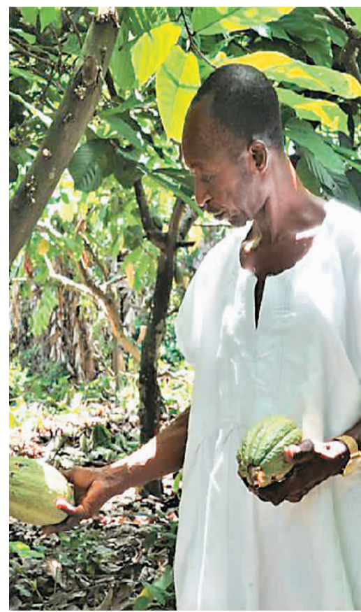
在加纳东部省一处可可种植园，农民正查看可可生长情况。

加纳的传统手工艺闻名世界，在众多极具特色的加纳手工艺品中，肯特布是无数游客的必买品。肯特布是一种由手织布、丝绸和棉条制成的加纳传统纺织品，在古代，只有国王或其他地位尊贵人士才有资格穿着肯特布；而在现代加纳，肯特布虽然不再限于特定人群，但其纯手工制作、工艺复杂，故价格不菲。或是双色相间的方格，或是多种色彩搭配的三角形交替出现，肯特布上的图案千变万化，令人眼花缭乱。有文献记载，肯特布有上百种图案设计，每一种图案都有自己的名字或故事，或与历史事件相关，或由历史上的酋长等命名。不同颜色也有着不同的象征，黑色代表成熟、蓝色代表和平、绿色代表成长……技艺高超的织布工还会在设计中融入传统文字与符号，为肯特布赋予了文化内涵。