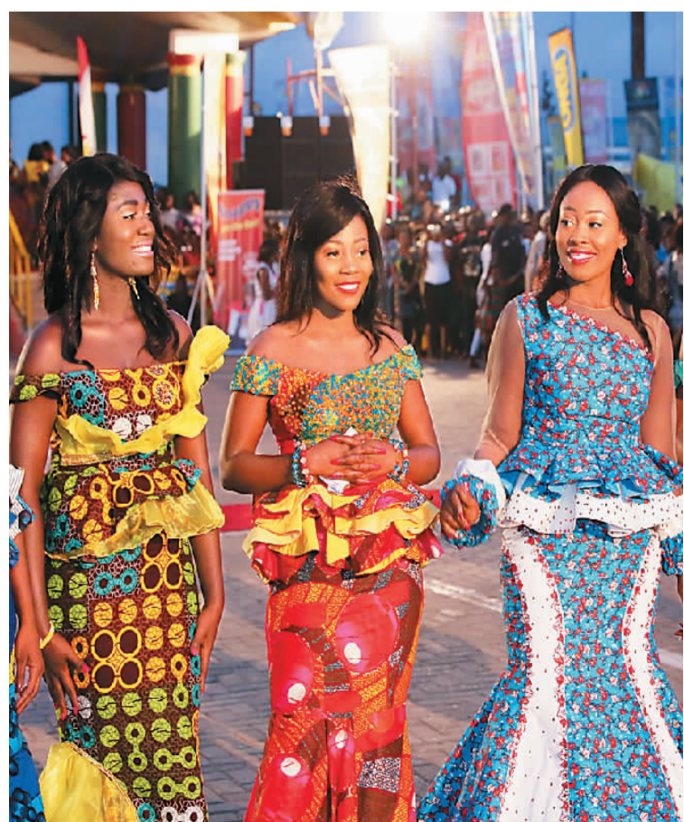
身穿民族服装的加纳女孩。