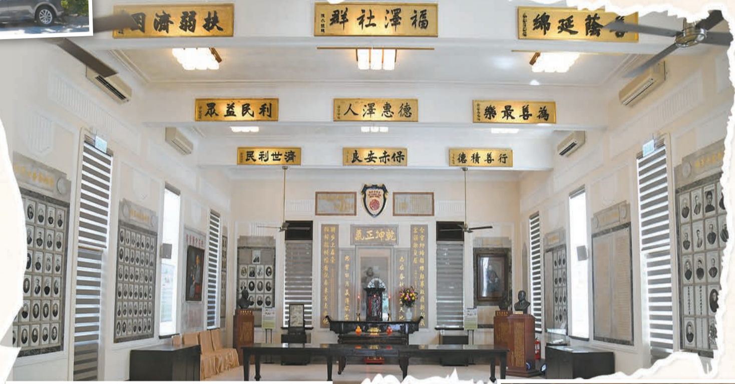
◀關帝廟正名為何東太夫人紀念堂，自落成至今仍是每年祭祀關帝及進行重要儀式的地方。