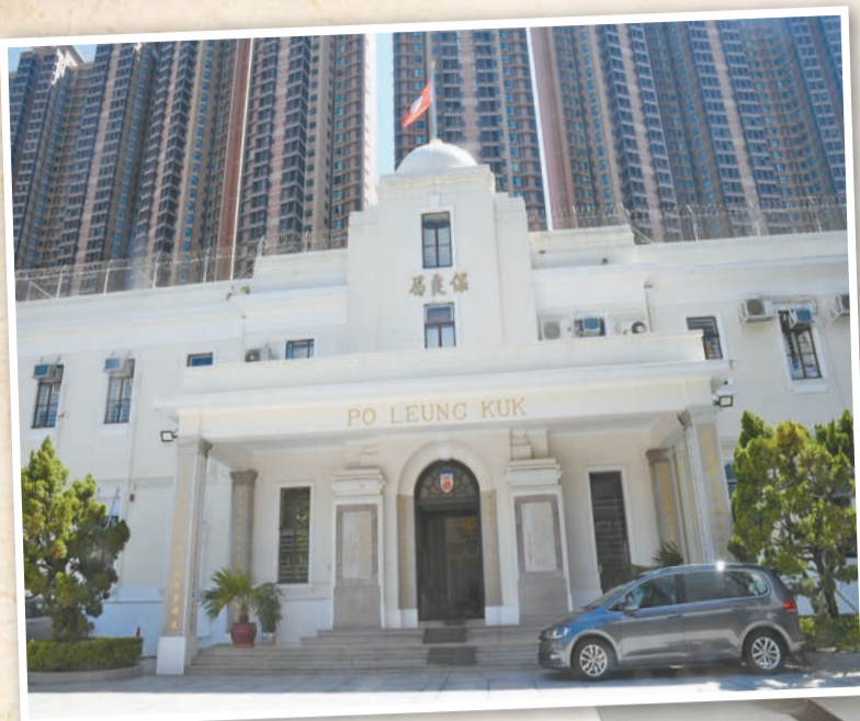
保良局總部中座大樓糅合中西文化古典韻味。