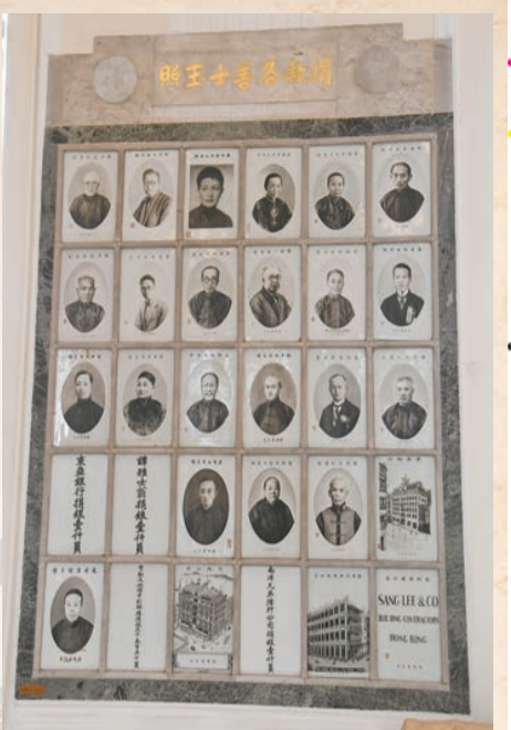
▲走廊的牆壁上鑲有善長仁翁瓷像以作紀念。