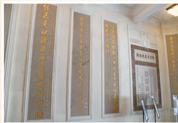
中座大樓走廊內部處處可見的都是中式石刻對聯和碑文；它們不少是由著名前清文人揮毫撰寫。