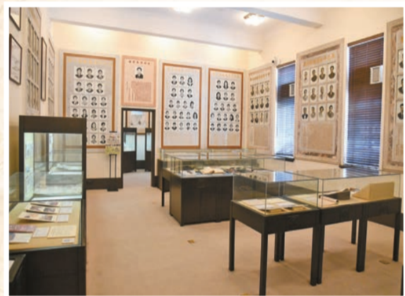
其中一個展廳置放保良局的珍貴文物。