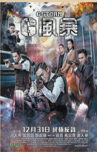
《風暴》系列第一集《Z風暴》票房9500多萬元（人民幣，下同），續集《S風暴》票房2億元；第3集《L風暴》票房4億元；第4集《P風暴》票房8億元。最後一集《G風暴》去年12月上映，雖然受疫情影響，但內地票房仍有6億3000萬元，成績亮麗。

1980年黃百鳴與麥嘉、石天成立新藝城影業，80年代出品《最佳拍檔》、《英雄本色》及《開心鬼》等膾炙人口的電影系列。後來，麥嘉與石天有感香港電影發展已到頂峰，1991年結束新藝城業務。黃百鳴認為香港電影仍有可為，於是成立東方電影，1992年出品由他監製的賀歲電影《家有喜事》，破香港紀錄取得4900萬港元票房，證明他對電影的堅持是正確的。黃百鳴表示：「《家有喜事》直到現在每到農曆新年電視必定重播，很多香港人不止看過一次。」可惜香港電影業的光環，維持到1995年便被「盜版」摧毀。黃百鳴指出當年盜版光碟在港無孔不入：「以往新片在星期六先上午夜場，目的是測試觀眾反應，之後可馬上作最後調整，趕在下一個周四正式上映。盜版出現以後，不法分子在午夜場偷拍錄影，到下一週一翻版光碟已在全港有售，較正式上映更快更廣。業界於是取消午夜場，卻因此失去修正影片的機會，對後期電影發展影響深遠。」1997年香港回歸，全港市道興旺，唯獨電影業卻全面萎縮：「不單止在香港、台灣、東南亞，甚至全世界亦有香港盜版電影，對港產片的海外銷售造成嚴重破壞。」當時香港電影外銷不包括內地，但內地同樣有香港盜版電影，黃百鳴苦笑指這也有好處，可以使內地觀眾提前認識香港演員，為日後北上發展埋下種子。1999年演藝界舉行「打擊盜版大遊行」後，政府立例管制，盜版集團有所收斂，不過電影業已是五勞七傷。