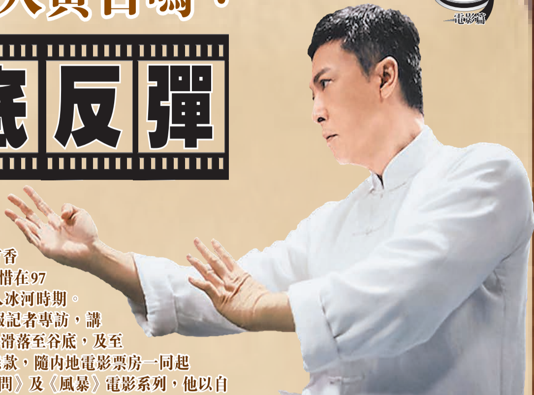
黃百鳴監製、甄子丹主演的《葉問》系列，4集累計票房收入23億元人民幣，甄子丹亦憑此電影系列蜚聲海內外，贏得「宇宙最強」稱號。