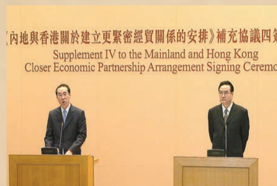
自2003年起，內地與香港簽訂了多份CEPA補充協議，令兩地經貿關係更緊密。圖為2007年國家商務部時任副部長廖曉淇（右）與香港特區時任財政司司長唐英年（左）簽訂補充協議。

《七劍》的香港票房約800萬港元，內地票房則是8000萬元人民幣，相差10倍。由此可見內地市場潛力之巨大。黃百鳴不諱言：「以往港產電影沒有內地市場，香港本土是最大的市場，第二大市場是台灣，之後是新加坡、星馬泰及韓國，當時內地市場還未成熟，但已有香港10倍的票房，絕對值得認真開發。」《七劍》取得理想成績後，翌年黃百鳴開拍了改編香港經典漫畫的《龍虎門》，內地票房6000萬元人民幣，第三年開拍警匪片《導火線》，只收到4000萬元人民幣，收入每況愈下。當時黃百鳴為了解內地觀眾的口味，而不斷嘗試風格：「經過數年摸索及分析後，發覺要攻佔內地市場，必定要拍和內地風格不一樣的電影，如拍古裝戲肯定不夠內地拍得好；戰爭片香港人也是拍不來；愛情或校園片，因兩地文化差異，難以引起觀眾共鳴。功夫片是香港的拿手好戲，香港龍虎武師很出色，於是決定開拍功夫片。」