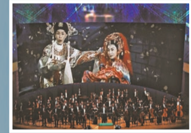
古典音樂和粵劇的碰撞，可以聽《帝女花》古典音樂詩。