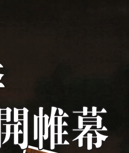
從9月到12月港樂將為古典樂迷獻上超過30場音樂會。

港樂音樂總監梵志登即將回港，親自指揮新樂季多場音樂會。