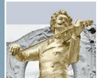
今年港樂最後一場音樂會是「新年音樂會」，將帶來小約翰·史特勞斯的圓舞曲。

在日前港樂召開的記者會上，港樂行政總裁霍品達侃侃而談，介紹了2022至23樂季的節目。