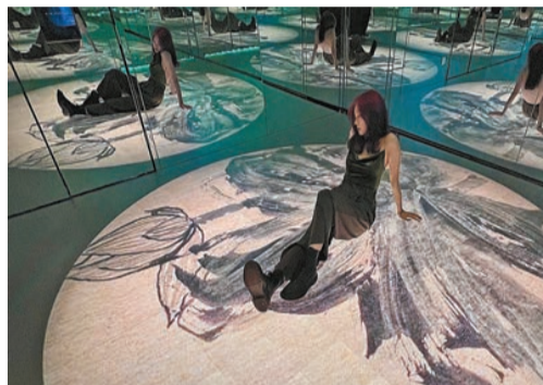
展覽房內，花與人在鏡牆下造成交錯的視覺效果。

內容：荷花是國學大師饒宗頤晚年的畫作重要題材，他筆下的荷花風格獨特，筆法與構圖達至前人未有的境界，因而被冠以「饒荷」之稱。為展現饒荷之美，山頂廣場GO Museum即日起舉辦「饒荷光影展」，將科技融於傳統書畫藝術，讓觀者沉浸在饒荷的世界裏，在光影交織中留下倩影。是次展出饒公的《設色荷花巨幅》、《愛蓮說》、《荷花畫禪》、《茅龍四色荷花》、《荷樣冊》、《吉語四色荷花四幅》、《百祿是荷》7套作品，主辦單位將畫作製成動畫，分佈於7個獨立房間，以投影、LED大螢幕、萬花筒等不同形式呈現。房間6面環鏡，營造水墨影像無限延伸的視覺效果，含苞、搖曳、盛放的饒荷圍繞觀者。參觀者可在花花世界中自由穿梭，拍照留念。 記者：Ruth