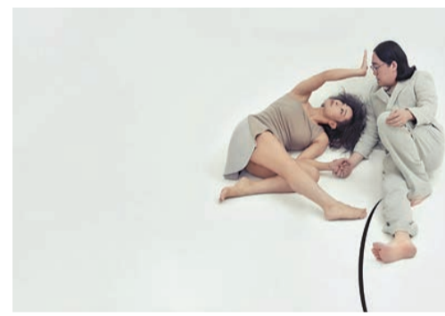
《停格中的塑像》和《哲學係咁跳》兩套作品均與哲學有關。

地點：沙田大會堂演奏廳 門票：HK$320、HK$260、HK$180 內容：城市當代舞蹈團8月將呈獻《停格中的塑像》和《哲學係咁跳》兩套作品，兩作並置演出。前者由得獎編舞家桑吉加創作，曾於意大利及內地等十度巡演；後者由本地哲學普及團體成員創作及演出，編舞家伍宇烈任舞台指導。兩套作品皆嘗試探討身體與精神的關係，旨在激發觀眾的思考。《停格中的塑像》靈感源於哲學家亞里士多德的《修辭學》，以舞蹈展現道德與情感之間的碰撞。《哲學係咁跳》則糅合演說與舞蹈，哲學家在台上邊跳邊問，要求觀眾一起反思現代舞的本質。 文：斯如