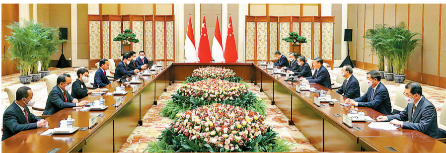
◆7月26日下午，國家主席習近平在北京釣魚台國賓館同印度尼西亞總統佐科舉行會談。兩國元首在親切友好的氣氛中就中印尼關係以及雙方共同關心的國際地區問題全面深入交換了意見，達成一系列重要共識。

國家主席習近平7月26日下午在北京釣魚台國賓館同印度尼西亞總統佐科舉行會談。兩國元首在親切友好的氣氛中就中印尼關係以及雙方共同關心的國際地區問題全面深入交換了意見，達成一系列重要共識。習近平指出，當前世界之變正以前所未有的方式展開，中印尼要同舟共濟，展現發展中大國責任擔當，踐行真正的多邊主義，堅持開放的區域主義，為推進全球治理提供東方智慧，貢獻亞洲力量。