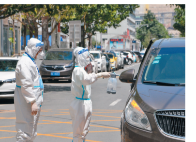
◆7月25日，甘肅省蘭州市，甘肅省疾控中心工作人員在取樣完成後為專用車輛進行消毒工作。

他同時強調，外國在華外交領事人員有義務尊重和遵守中方防疫規定，這也是遵守前述兩個公約的義務。