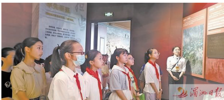
小講解員到木蘭溪展示館開展研學活動。

(莆田網訊)7月上旬,莆田市青少年宮紅領巾戲劇社研習班招新面試舉行。經才藝展示、表演模仿等環節的考核,9名同學通過面試,進入戲劇社免費學習莆仙戲、戲曲表演基本功。