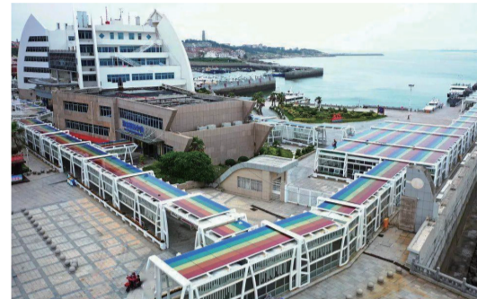
湄洲島風雨廊光伏建築一體化(BIPV)項目。

圍繞在湄洲島建設全國首個“零碳島”目標,莆田供電公司報送的該項目運用數字化智慧能源技術,助力實現人與自然和諧共生。該公司將生態保護區用能接入數字能源平臺實時監測,為島上300畝紅樹林濕地保護、海鳥棲息、灘塗生物生長等提供“電力+生態”數據服務。運用數字能源監控平臺,實時監測全島用能數據,為當地排污治理提供數據支撐,助力做好海島生態環保、應對氣候變化等。(湄洲日報記者 吳雙雙 通訊員 陳娜麗)