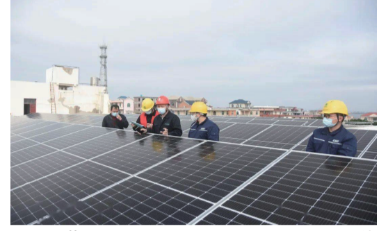
莆田供電公司員工服務下山村光伏發電項目。