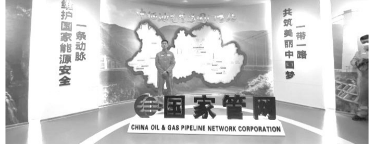
图为国家管网集团西南油气管道有限责任公司德宏输油气分公司工作人员介绍情况

中新网云南瑞丽7月27日电 记者27日从国家管网集团西南管道公司德宏输油气分公司(下称德宏输油气分公司)获悉,作为中缅油气管道的首个运营单位,德宏输油气分公司自投产以来,截至2022年7月25日累计向国内输送天然气356.7亿标方,原油5135.99万吨。