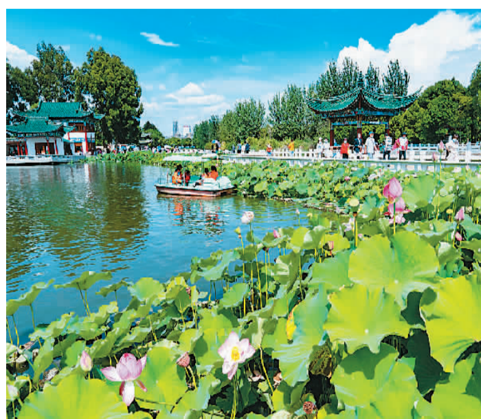
第三十六届全国荷花展近日在云南省昆明市大观公园举行,吸引各地游客前来游玩赏荷。图为昆明大观园内,游客在观赏盛开的荷花。

据介绍,“天津惠民保”拓宽了参保适用人群和保障覆盖范围,同时将36种院外特定药品费用纳入保障。