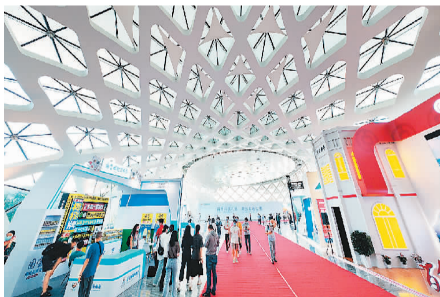
七月二十五日,观众进入消博会展馆。

本届消博会覆盖服务消费、时尚生活、食品保健品等多个领域,消费精品之多令人大饱眼福。 在高端食品保健品展区,日本护肤及健康食品品牌芳珂带来了综合营养包、机能性表示食品、健康辅助食品、维生素矿物质系列等四大系列共60余款产品,全面展示其在均衡营养、体重管理、口服美容、睡眠呵护等领域的新成果。 “老朋友”凯沃国际携劳斯莱斯库里南、兰博基尼Urus等6辆新款零关税车亮相本届消博会,免税额度从20万元至数百万元不等。 在服务消费展区+旅居生活展区,傲胜带来了能按摩的电疗椅,在保持人体工学设计的基础上,搭载了傲胜招牌专利“V手按摩”技术,能够模拟真人按摩师提、拉、抓、握的专业按摩手法,吸引不少观众现场体验。