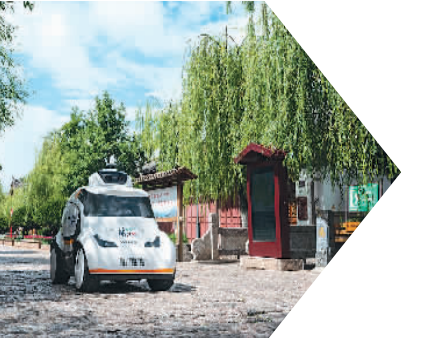
▲5G无人巡逻车在云南丽江古城进行巡逻作业。