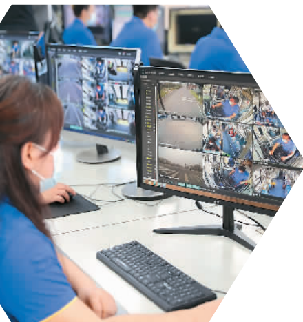
▲山东青岛西海岸新区依托移动互联网、云计算、大数据、车联网等先进技术和理念打造“智慧公交”,助力市民绿色出行。图为青岛真情巴士集团智慧公交指挥中心调度员在实时查看车辆运行情况。