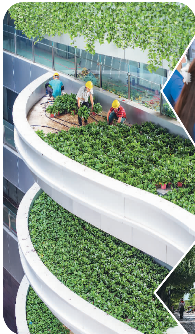
▲位于海南海口江东新区起步区的海南能源交易中心大厦是集智慧、科技、低碳、高效为一体的“智慧办公场所”,为用户提供舒适的办公环境。图为大厦施工人员进行绿植进行更换。

推行城市运行一网统管,探索建设“数字孪生城市”,推进市政公用设施及建筑等物联网应用、智能化改