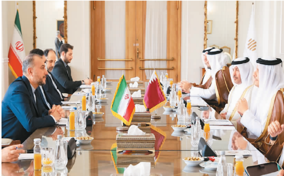
七月六日，伊朗外长阿卜杜拉希扬（左一）在德黑兰会见到访的卡塔尔副首相兼外交大臣穆罕默德（右一）。阿卜杜拉希扬表示，在恢复履行伊核协议问题的全面协议的谈判中，伊朗没有提出超出伊核协议范围的“过度要求”。

眼下，美国和伊朗关系雪上加霜，伊朗和以色列关系剑拔弩张。在大国博弈不断加剧的今天，伊核协议谈判将往何处去？