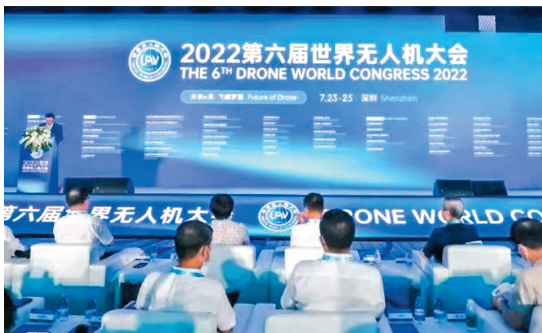
◆ 2022第六屆世界無人機大會23-24日在深圳舉行，大會主論壇及12場平行論壇吸引4,000多位中外專家和企業家參加。

儘管遭受新冠疫情的影響，楊金才表示，近兩年來無人機因無接觸配送、智能化應用而逆勢上揚，保持30%的高速增長，無人機、無人系統等產品有了廣泛的應用，預計今年中