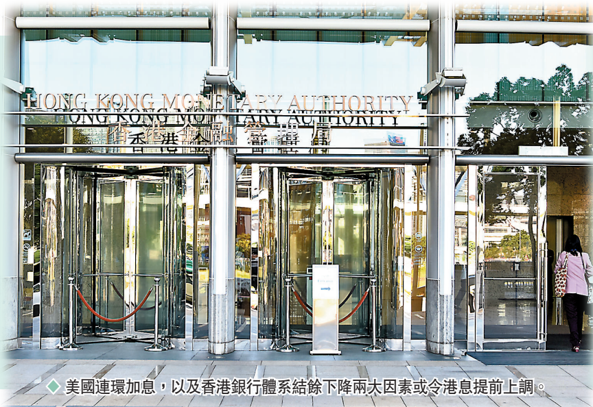
◆ 美國連環加息，以及香港銀行體系結餘下降兩大因素或令港息提前上調。