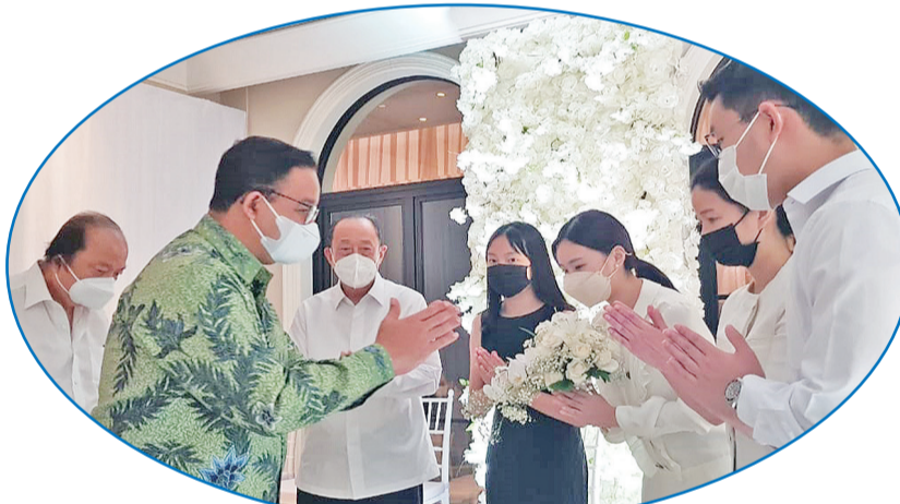
阿尼斯省长前来吊唁