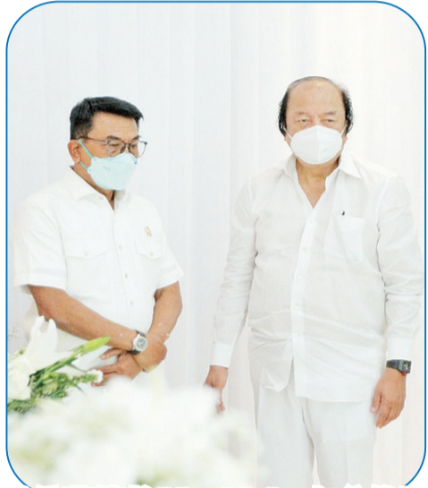
总统幕僚长 Moeldoko 与翁俊民

林文俊、李新茂等。海内外各界人士还以发唁电、刊登挽告和敬献花圈等多种方式表示悼念。(本报记者)