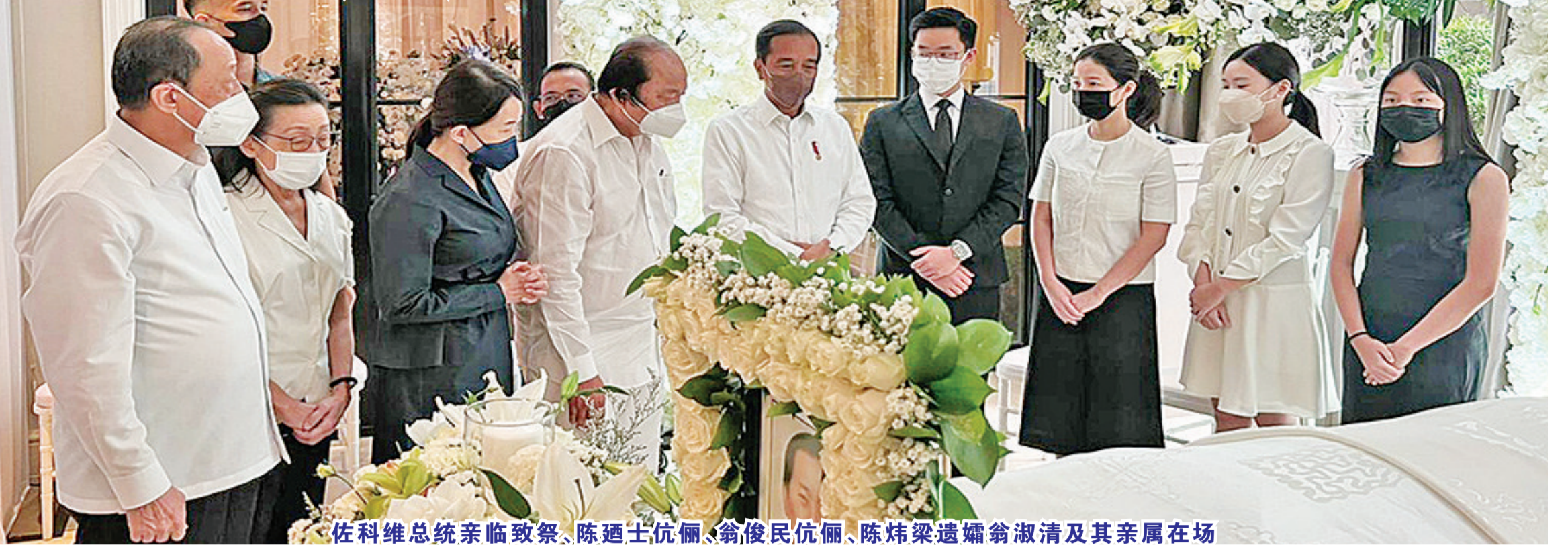
佐科维总统亲临致祭、陈迺士伉俪、翁俊民伉俪、陈炜梁遗孀翁淑清及其亲属在场

【本报讯】7月25日上午8点，佐科维总统从茂物行宫前往陈府治丧处，吊唁23日逝世的陈炜梁先生，惋惜翁俊民