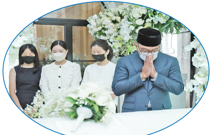
西瓜省长 Ridwan Kamil 前来吊唁