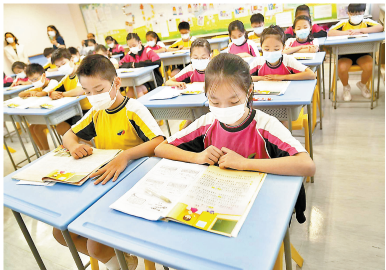
◆ 圖為香港一小學，學生在上語文課。