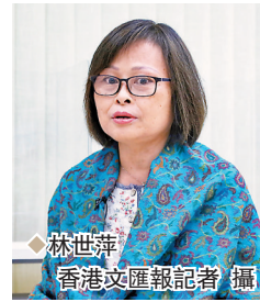
◆ 林世萍 香港文匯報記者 攝

學習普通話不單為生活帶來方便，更可促進學習者對國家的認識和了解。任職瑜珈導師的林世萍，在疫情前經常會在深圳等內地城市旅遊穿梭，「那時覺得自己普通話還不錯，不管說什麼別人好像都能明白。」直到有一次，她在內地購買一套房子準備退休後居住，為此要辦理一系列手續的時候，「我這才發現，原來我的普通話完全不夠用，我說的很多他們都不明白，所以我就想我一定要學好普通話！」