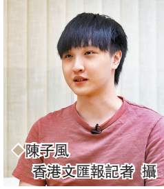
◆ 陳子風 香港文匯報記者 攝

除了希望便利生活和工作，學習普通話的原因還可以是因為愛。剛從美國大學本科畢業回港，即將在香港理工大學升讀碩士的陳子風坦言，自己學習普通話的動機很單純，沒有什麼彎彎繞繞的理由，純粹是為了能夠和內地的家人親戚及朋友作出更好的溝通與關懷，「我覺得學好普通話，就可以跟他們有更好的交流，但有時候在香港不是有太多可以實踐的機會，所以會在上課時多多練習。」