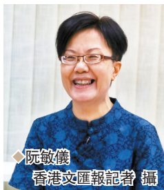
◆ 阮敏儀 香港文匯報記者 攝

「普通話一點也不普通！」從事茶葉批發和零售的阮敏儀因為工作需要，長時間都在內地與香港兩邊走。她笑言，過去內地同事和朋友都笑她的普通話講得「很普通」、「港普」和「很爛」，從那時起她已立下決心要學好普通話，但礙於工作繁忙，一直沒機會正式學習，後來在一次偶然的機會下認識到香港普通話研習社的老師，開始了其普通話學習之旅。現在已說得一口流利且標準的普通話的她自信滿滿，直言：「將來回到內地工作的話，同事和朋友们一定會誇我的普通話大有進步的！」