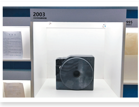
◆內地2003年首次引進3D打印機。圖為原料機盒。