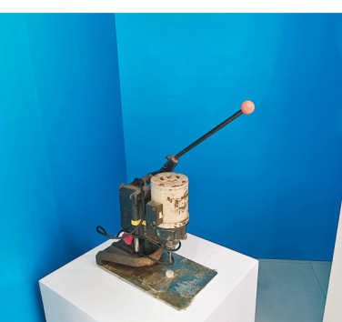
◆港商手工打孔機已有逾30年歷史。