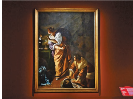
阿爾泰米西婭·真蒂萊斯基作品《友弟德和使女割下撒羅斐乃的頭顱》，約1645至1650年。