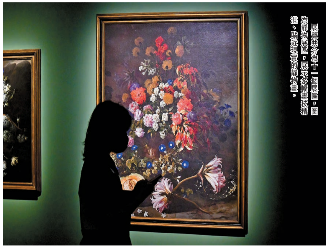
展覽共分為十一個展區，圖為靜物展區，展示多幅畫技精湛、貼近現實的靜物畫。