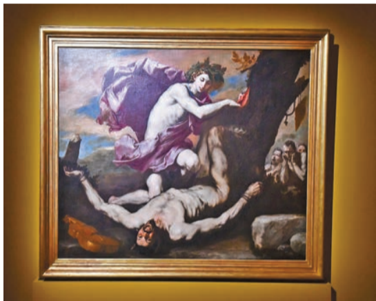
胡塞佩·德·里貝拉作品《阿波羅與瑪爾敘阿斯》，1637年。作品描繪神話中最具戲劇性的一刻，結合了現實主義、出色的色彩處理和生動的風景構圖。

日期：即日起至11月2日 時間：星期一至三及五 上午10時至下午6時 星期六、日及公眾假期 上午10時至晚上7時 地點：尖沙咀梳士巴利道10號 香港藝術館2樓專題廳 票價：HK$10 (標準票)