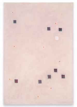
拉烏爾·德·凱澤作品《來吧，再來一次5號》，2001年。(圖片來自拉烏爾·德·凱澤家族及卓納畫廊、拉烏爾·德·凱澤/紐約藝術家權益協會(ARS)/比利時SABAM)