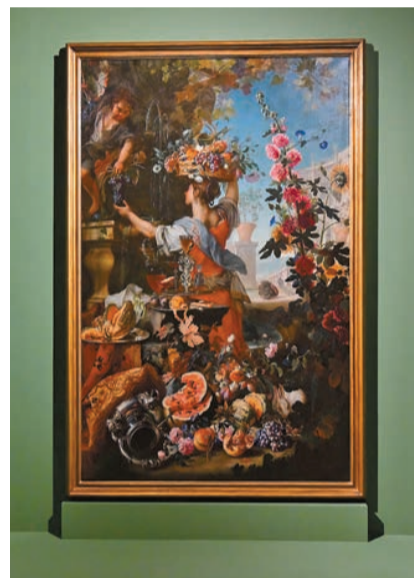
貝內茲及卡洛·馬拉塔作品《鮮花、水果及摘葡萄的女人》，1696年。

極其細緻的寫實手法及富情節性的構圖，也是巴洛克藝術的特點。喬凡·巴蒂斯塔·雷科的《靜物——羊頭》將物件的質感描繪得惟妙惟肖，瓷器、銀器、麵包等物品予人的質感皆不同，讓人感受到畫家深厚的繪畫功底。羅欣欣解釋，當時畫家擅長將普通物件變成高級藝術品，帶給觀者良好的視覺體驗。畫家希望通過靜物畫提醒觀者要及時享受大自然，因此會單純地重現日常物件的質感、顏色等，並突出自己的繪畫技術。這幅靜物畫並將物品畫於桌子邊緣，利用了短縮透視手法，令人覺得物品搖搖欲墜，觸手可碰一般。