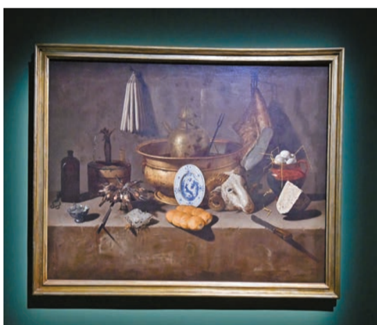
喬凡·巴蒂斯塔·雷科作品《靜物——羊頭》，約1650年。