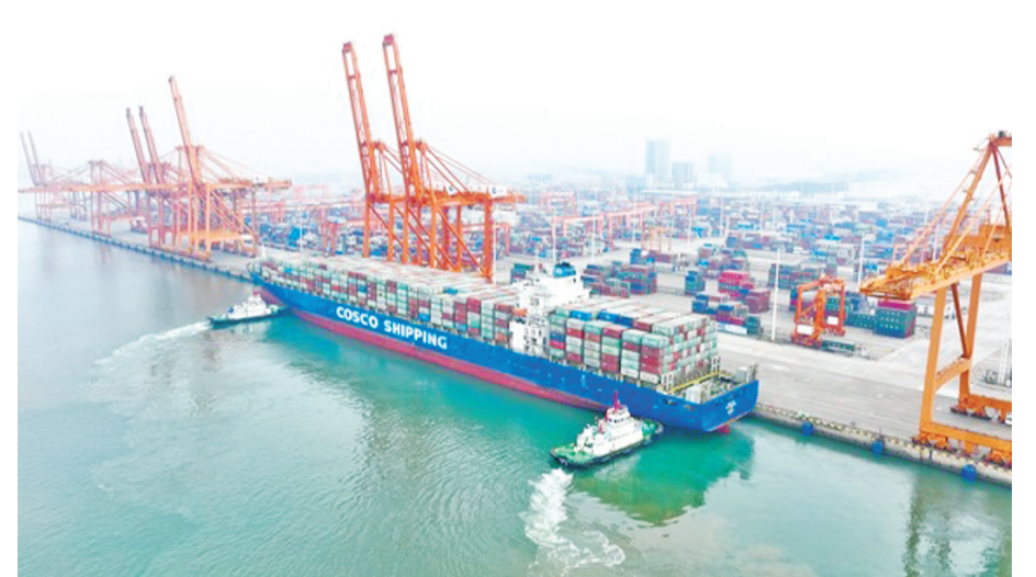
3 月 2 日，繁忙的广西北部湾港钦州集装箱码头(无人机照片)。

“RCEP 对我们公司的发展带来了积极影响，关税减让和通关时效变快，让我们进口东盟商品日益便利和多样。”广西蚂蚁洋货供应链管理有限公司运营经理彭雪艳说，公司正积极与东盟国家多家商品品牌联