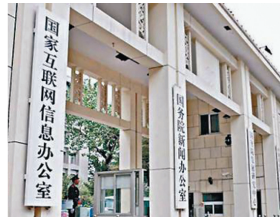
◆網信辦稱，滴滴公司違法違規行為情節嚴重，結合網絡安全審查情況，應當予以從嚴從重處罰。資料圖片

香港文匯報訊（記者 莊程敏）經過長達一年的網絡安全審查後，國家網信辦對滴滴開出80.26億元人民幣的大罰單，是中國互聯網公司違規罰款第二大金額。網信辦有關負責人21日就案件相關問題回答記者提問時指出，此次對滴滴公司的網絡安全審查相關行政處罰，與一般的行政處罰不同，具有特殊性。滴滴公司違法違規行為情節嚴重，結合網絡安全審查情況，應當予以從嚴從重處罰。