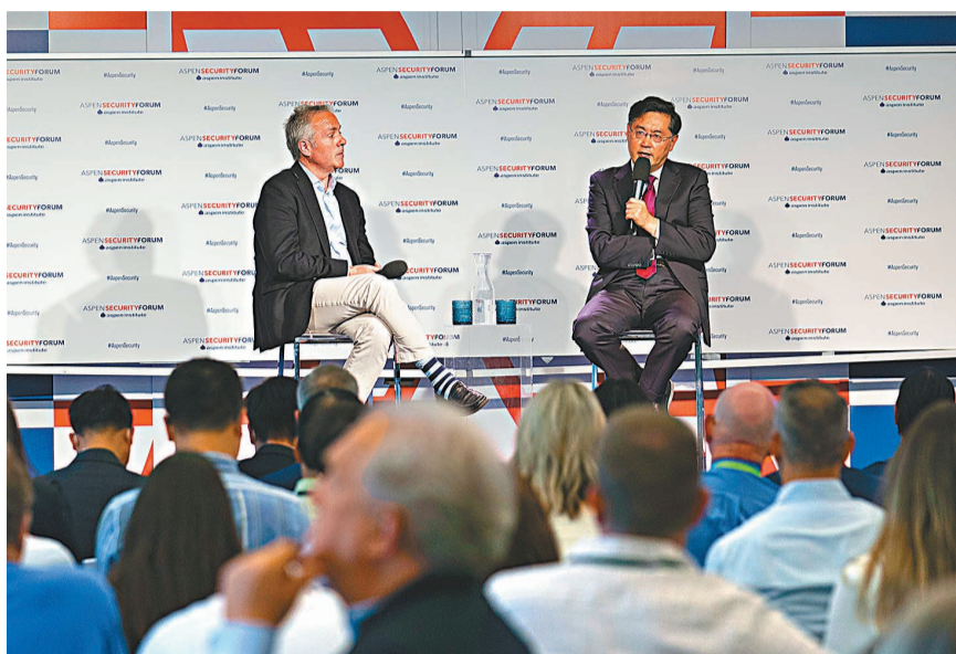
◆中國駐美國大使秦剛20日出席阿斯彭安全論壇期間的一場「爐邊對話」活動，就中美關係闡述中方政策立場。

近年來，蔡英文當局拒不接受一個中國原則，借助美國變換手法搞「漸進式台獨」；美方不斷歪曲和掏空一個中國政策，大肆提升美台官方關係，不斷派高官訪台，售台大量先進武器，發表「軍事防衛台灣」錯誤言論。「我們不放棄非和平方式，不是針對台灣人民，而是為了遏制『台獨』分裂勢力，防止外部勢力干涉，維護祖國和平統一的前景。美方多次表示堅持一個中國政策，不支持『台獨』，不希望同中國在台灣問題上衝突對抗，希望美方說到做到。」秦剛強調，中方敦促美方切實恪守一個中國原則和中美三個聯合公報規定，同中方一道堅定反對和遏制「台獨」。