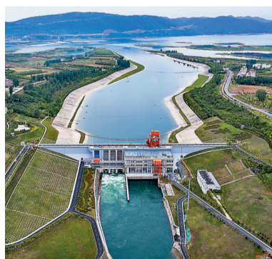
◆河南省南陽市淅川縣拍攝的南水北調中線工程陶岔渠首（無人機照片）。資料圖片

數據顯示，截至22日，中線一期工程已累計生態補水超過89億立方米，受水區特別是華北地區，乾澇的洼、淀、河、渠、濕地重現生機，湖生態環境復甦效果明顯。