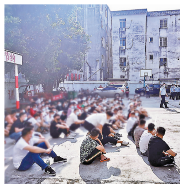
◆圖為陽江市公安局破獲「5·21」組織他人偷越國（邊）境案。

這幾天，神舟十四號航天员乘組在軌狀態良好，正在加緊整理從天舟三號轉移出來的物資，並進行了手控交會對接備份方案的訓練。目前，太空站組合體已調整到軌道，具備與問天實驗艙進行交會對接的條件。