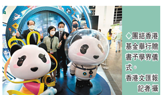
◆團結香港基金舉行贈書予學界儀式。

香港文匯報訊(記者 文森)香港書展20日開幕，適逢今年是香港特區回歸祖國25周年，團結香港基金與轄下香港地方志中心和中國文化研究院聯合舉辦《回歸·情義25載》學界贈書儀式，向全港約1,000所中、小學校圖書館送贈書冊，讓學生更全面認識回歸以來香港的歷史，了解香港與國家關係密不可分，培養年輕人對國家、民族及社會的認同感。 出席儀式的香港教育局局長蔡若蓮表示，書冊記載香港回歸祖國以來，25項兩地人民互相交流、共同打拚的歷史大事，期望學校收到書冊後，鼓勵師生善加運用，增進知識，並讀出當中的情與義，推展國民及價值觀教育，薪火相傳，繼續發揚。這本紀念書冊中的資料和圖片也是不錯的學習素材，亦將回歸情義送進校園，鼓勵老師可多加運用。她表示，教育局會採取多元化措施，為學校提供課程指引，開發教學資源，舉辦全方位學習活動，支援學校全面及有系統地推動國家安全及國民教育，讓學生認識國情。 團結香港基金呈獻《回歸·情義25載》由香港地方志中心撰寫，中華書局(香港)有限公司發行，輯錄兩地大事以及多張珍貴歷史相片，展示兩地之間的互動與交流。該書分為五大主題，分別是「超越25年的家國情」、「血濃於水同舟共濟」、「協同發展 互利共贏」、「奧運夢·航天夢·中國夢」、「勇立潮頭 融入大局」。