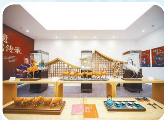
陽澄湖國際藝術交流中心。