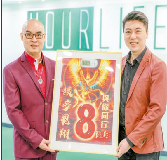
今年優樂生活踏入8周年，會員人數已達18萬，人數仍然節節上升。