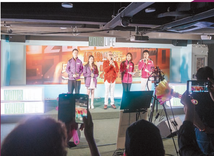
本年5月優樂生活繼續舉辦520網上演唱會直播，以歌聲發放正能量，幫助人擺脫「疫情後遺症」。