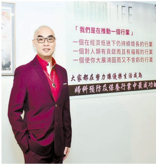
優樂生活在低迷的市道中仍然持續增長。

有自家的物流公司，已經做到網購及物流的一條龍組合。「由於優樂生活擁有自己的物流公司，因此我們是全中國免費送貨的，8年來沒有收取買家一分錢的運費，最遠的送貨地點是內蒙古。」由此可見，早在8年前賴永鈞博士已經一直用新時代的生意模式引領着優樂生活，婦科產品也因為快速的物流，而可抵達偏遠的家庭，造福更多的婦女。