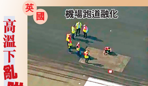
英國 機場跑道融化 ◆倫敦盧頓機場一小段跑道“凸起”需緊急維修，一度暫停航班升降。