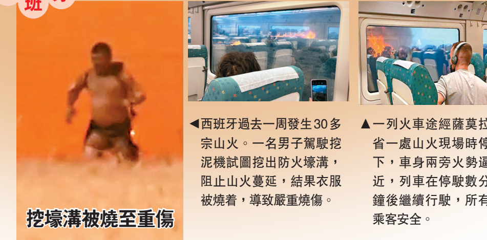
西班牙 挖壕溝被燒至重傷 ▲一列火車途經薩莫拉省一處山火現場時停下，車身兩旁火勢逼近，列車在停駛數分鐘後繼續行駛，所有乘客安全。