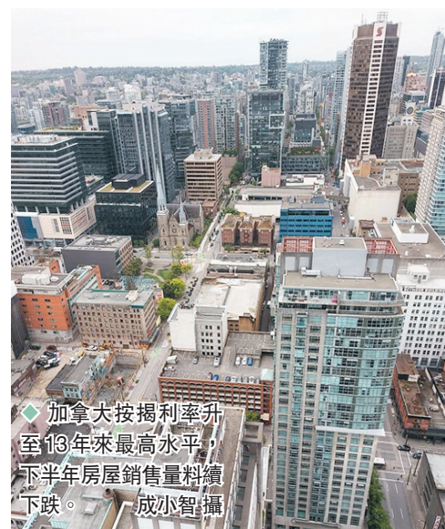
◆加拿大按揭利率升至19年來最高水平，下半年房屋銷售量料續下跌。