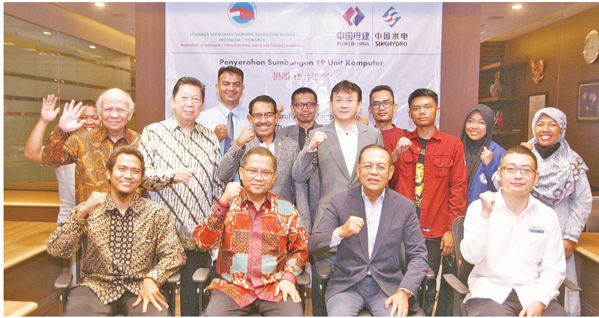
与会嘉宾和习经院诸理事合影