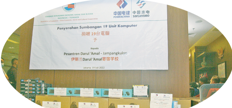
中国电建捐赠的 19 台电脑