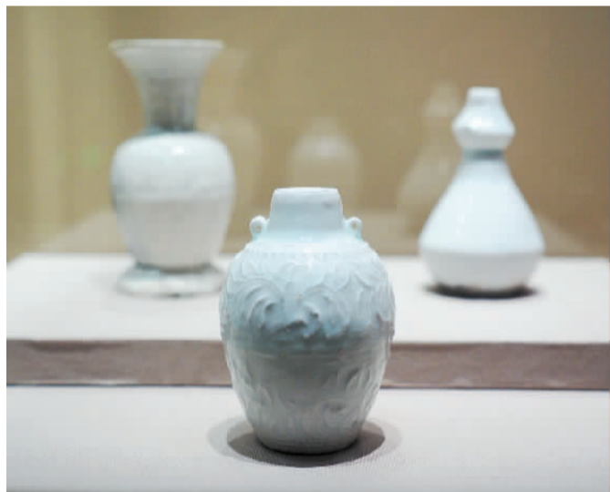
“南海一号”沉船出水的南宋青白釉双系小罐。

“南海一号”沉船出水的南宋青白釉印花瓷器、龙泉窑青瓷，“碗礁一号”沉船出水的清代青花盖罐、五彩瓷器……这些精美的外销瓷器见证了中国古代海上丝绸之路的繁荣，对研究中国航海史、海外交通史具有重要价值。展厅里还陈列着两套水下考古所用的蛙人潜水服，配合投影在地面上的水波光效，让观众感觉仿佛亲临海底沉船发掘现场。