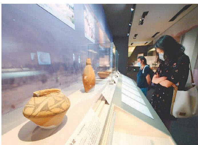
观众参观“积厚流广——国家博物馆考古成果展”。