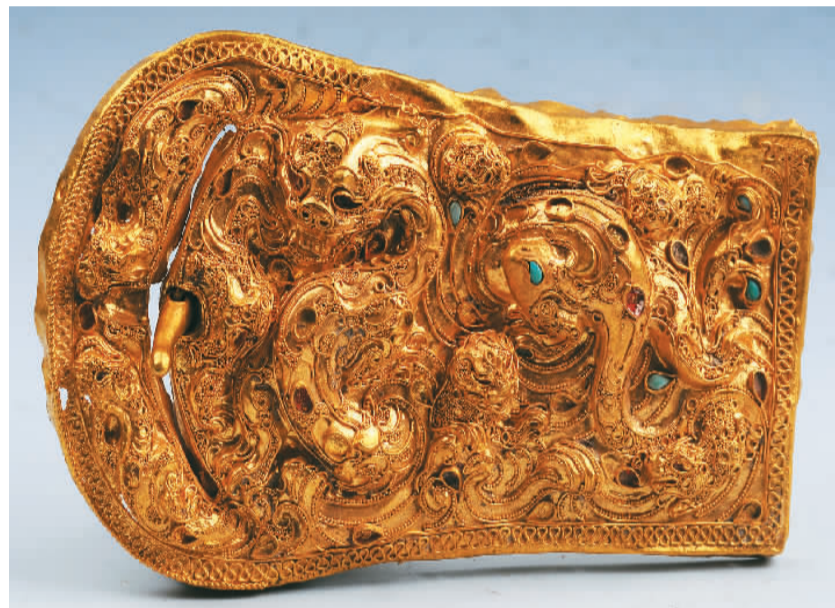
▲唐开元二十一年唐益谦、薛光泚、康大之请过所案卷。 ▲汉代八龙纹金带扣。

实物。文书记录内容丰富，涉及军事、政治、经济、文化、法律、交通、社会生活、宗教信仰等方面，诸多内容均为首次发现，具有极高的史料价值。展厅专设陈列克亚克库都克烽燧遗址出土的部分纸质文书和木牍，旁边还展示了烽燧的立面复原模型，让观众感受新疆最新的重大考古发现成果。