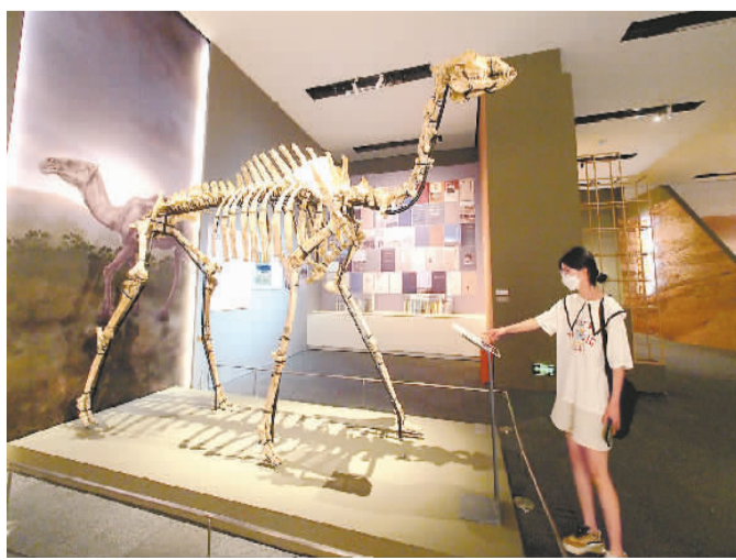
金远洞巨副驼骨架。

本次展览还引入科技元素，增强互动体验。“中条山金”展柜将实物展示与电子触屏结合，多角度呈现了晋南中条山地区闻喜千斤遗址、绛县西吴壁遗址的考古成果。展柜里陈列着遗址出土的石锤、矿渣、范芯等，展柜玻璃则被设计成一块电子触摸屏，展示了考古现场图片、木炭窑模型以及从冶铜到铸造青铜器的工序等。点击屏幕上的模块，就能看到更为详细的解读。这两处遗址是考古工作者首次在中原地区发掘的采矿、冶铜遗址，极大地填补了冶金考古领域的空白，为认识夏商王朝控制、开发、利用中条山铜矿资源提供了珍贵的实物资料，其中绛县西吴壁遗址入选了“2019年度全国十大考古新发现”。