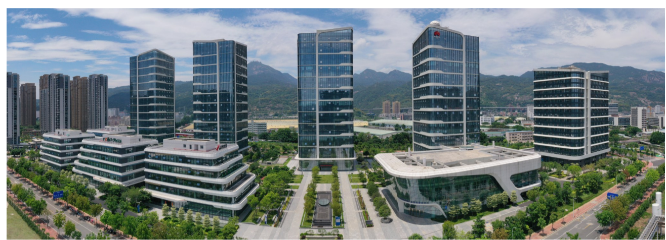
福州物联网产业园。