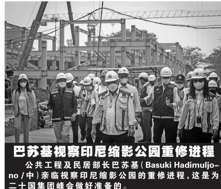
巴苏基视察印尼缩影公园重修进程 公共工程及民居部长巴苏基(Basuki Hadimuljono/中)亲临视察印尼缩影公园的重修进程,这是为二十国集团峰会做好准备的。