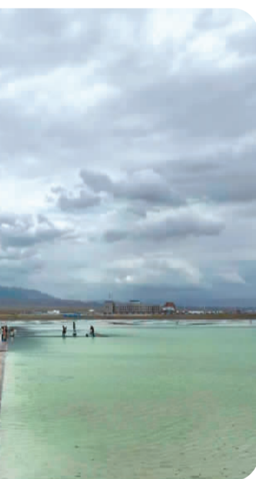
游客在湖面欣赏美景。

茶卡盐湖内盐为天然结晶盐，晶大质纯、盐味醇香，是理想的食用盐，因受其特定的地理、气候、环境等自然因素的影响，与其它盐比较具有晶体规则、氯化钠纯度高、可溶性杂质低、不易结块、不含对人体有害的物质特点。而且，其盐晶中含有的矿物质，使盐晶呈青黑色，故称为“青盐”，茶卡盐湖因盛产大青盐驰名，成为中国绿色食用盐生产基地。2008年之后，景区开始在保护基础上创新工业遗产活化利用，展示采盐百年铁轨、火车机头及电力设施等工业遗产，并用百年铁轨开发3.2公里的有轨观光小火车，2016年，用采盐航道开展盐湖游船观光，充分展示景区工业文化。