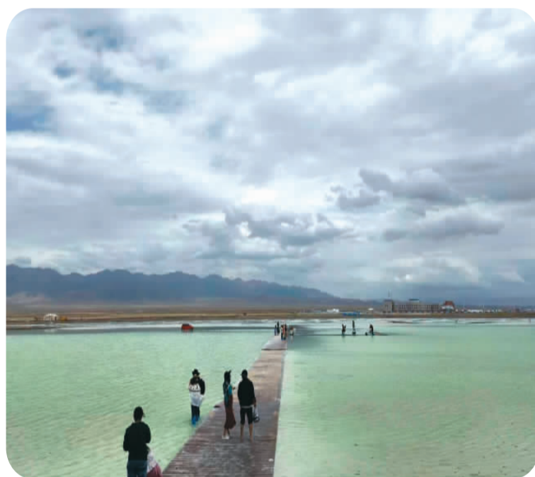
游客在湖面欣赏美景。

茶卡盐湖历史悠久，是中国盐文化发源地之一，自古称为西官咸池。同时，在一带一路中占有重要地位，是古丝绸之路（青海道）和唐蕃古道的重要站点，也是由中原进入西藏的