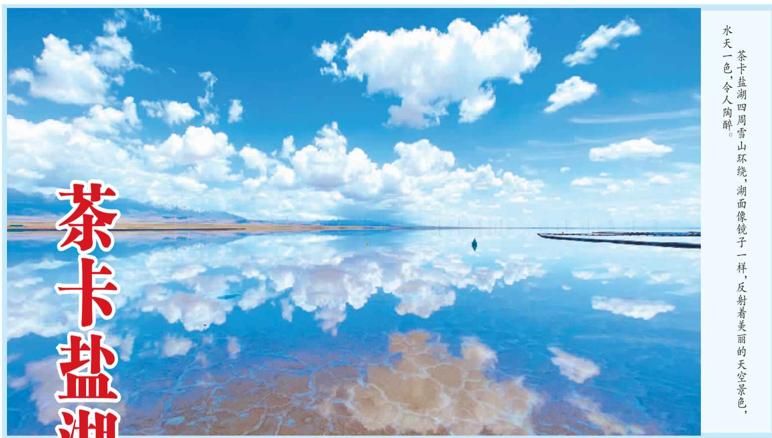
茶卡盐湖四周雪山环绕，湖面像镜子一样，反射着美丽的天空景色，水天一色，令人陶醉。