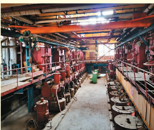
上图为1964年江门甘蔗化工厂编制的化驗操作規程，涉及对甘蔗制糖原材料和半成品的分析实验，成为业内参考资料。下图为江门甘蔗化工厂（制糖分厂）保存现状。