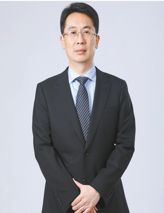
廈門國際銀行董事長王曉健。

閩港合作是集友銀行近年來業務發展中的一大亮點。王曉健透露，近年來，集友銀行致力於搭建閩港合作的橋樑，發揮機構布局優勢，架起了連通閩港金融市場、資本市場的橋樑，為超過2萬戶福建籍客戶提供金融服務，在港投融資每年發生額超百億。