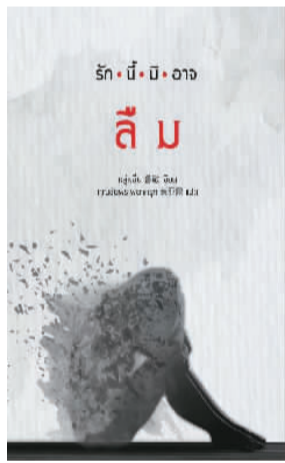
鲁敏长篇小说《此情无法投递》泰语译本