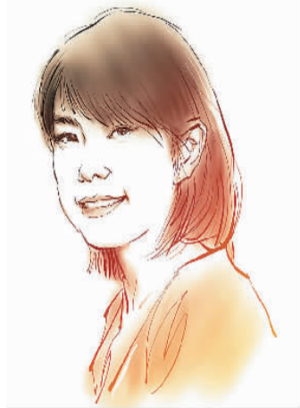
鲁敏 郭红松 绘

编号的工卡、用记账本写笔记的出纳员，大家都带着那种共同的、朴素的奋斗感。那时的业余夜校是带有辅助与普惠意味的，在补充教育、知识建构、职业变迁上，可谓其怀阔哉、其功伟哉，那种鼓励与推动的力量，深深融入我们这一代人的血脉，使得我们始终坚信，奋斗与努力，即是生活的正义。