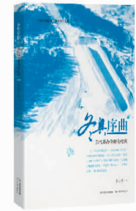
《冬奥序曲》朱冈平著