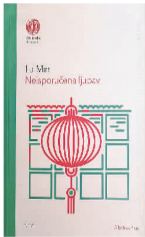
《此情无法投递》塞尔维亚语译本