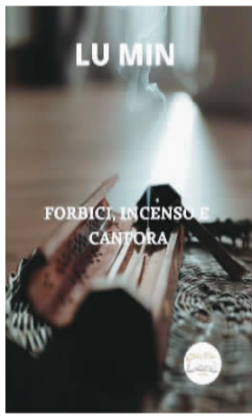
鲁敏意大利语中短篇小说集《剪刀，香柱，樟木》