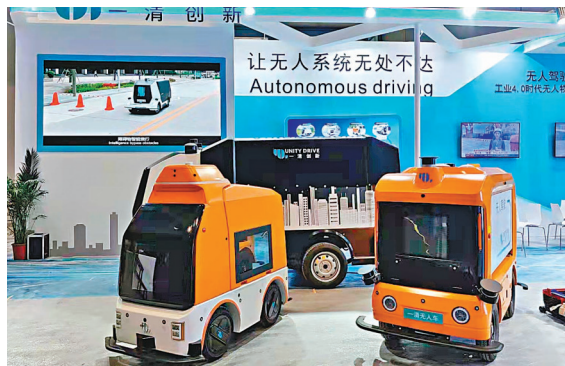
◆一清創新的無人車。