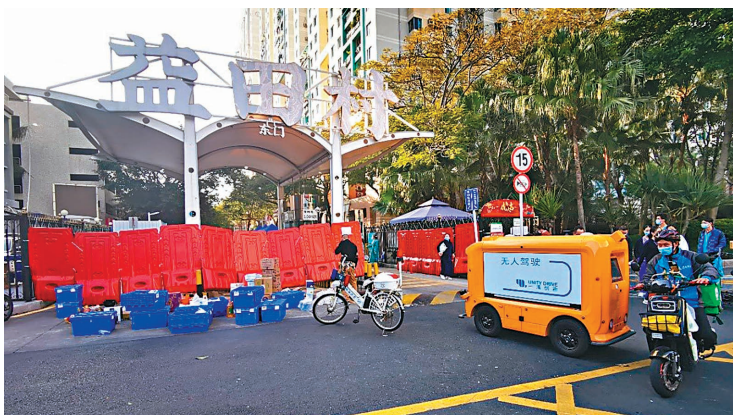
◆一清創新的無人車今年參與深圳抗疫。