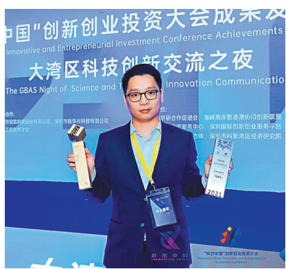
◆一清創新的無人駕駛項目在「科創中國」創新創業投資大會獲得第5名。