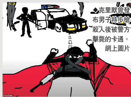
◆克里默曾發布男子持步槍殺人後被警方擊斃的卡通。網上圖片

與歌迷和朋友交流，當中很多訊息都是政治性。頻道3月曾上載一條影片，內容是賓夕法尼亞州一名州府官員1980年代在電視上直播吞槍自殺，克里默當時留言說：「我希望所有政客都可以像這樣演說。」