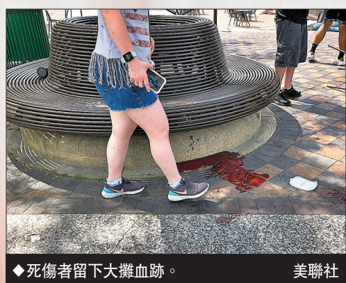
◆死傷者留下大灘血跡。