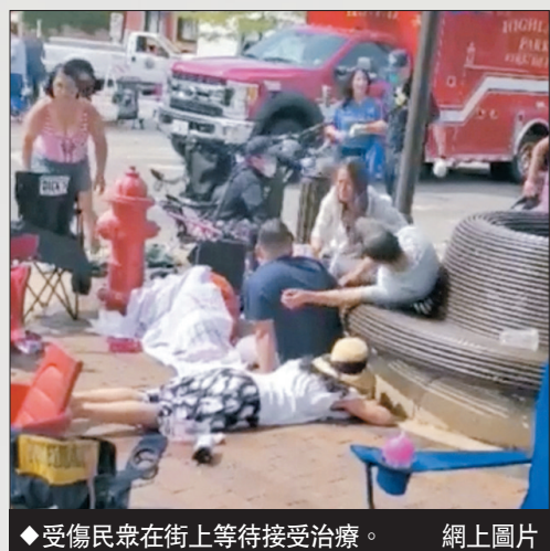
◆受傷民眾在街上等待接受治療。