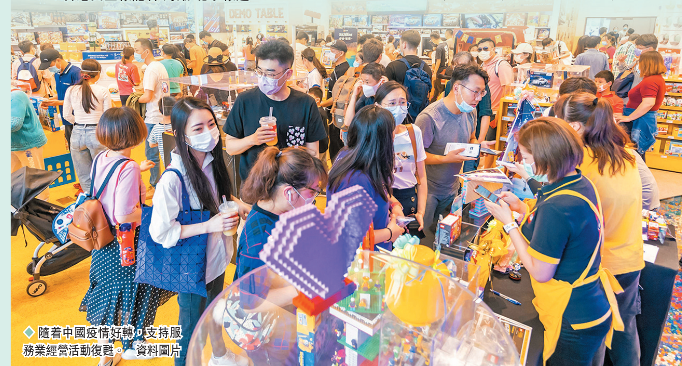
◆ 隨着中國疫情好轉，支持服務業經營活動復甦。資料圖片

整體看，供給、需求、出口同步恢復，供給恢復速度更快，但同時，就業依然疲弱，積壓工作維持不變，企業投入成本仍在持續增加，製造業企業受原材料和運費影響尤為明顯。