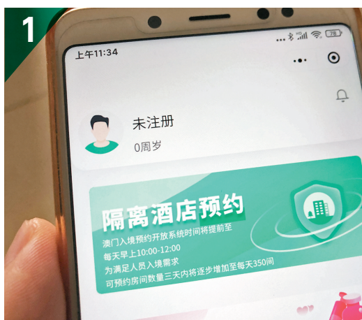
◆自澳門入境人員須提前通過「健康珠海」微信小程序預約隔離酒店。

「從澳門到珠海可以用人臉識別，為什麼入境深圳不用這種方式？」深港跨境人士陳先生受訪時表示，健康驛站的註冊雖然是實名制，但是登錄沒有要求和限制，這就給黃牛有可乘之機，限制IP登錄的方式並沒有辦法從根本上解決這一問題。深圳健康驛站系統應借鑒珠海實行人臉識別登錄功能，非常有效，因為黃牛無法登陸就沒有辦法搶名額。跨境家庭溫先生亦表示，現時除了增加健康驛站的預約名額，加大力度打擊「黃牛黨」的炒賣活動更為重要，從登錄源頭嚴防，較事後再追蹤會更為有效。