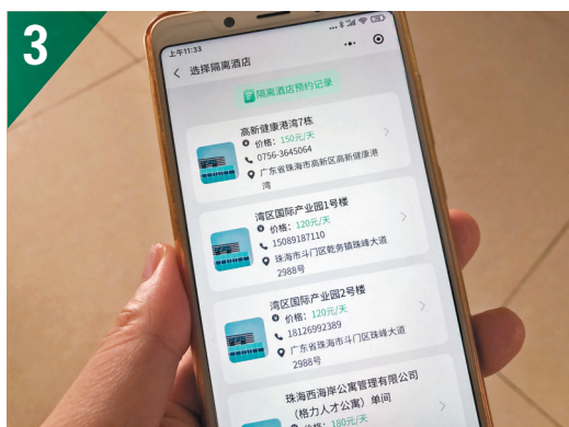
◆自澳赴珠隔離酒店價格每天在100元到420元人民幣不等。