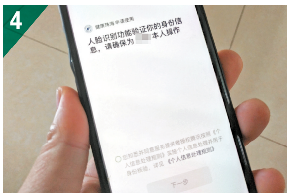
◆自澳赴珠隔離酒店預約的賬號註冊增設「人臉核身」。圖為人等。