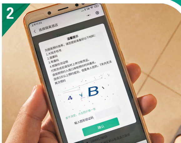
◆同一用戶連續3次以上預約成功但未入住者，7天內無法再次預約。