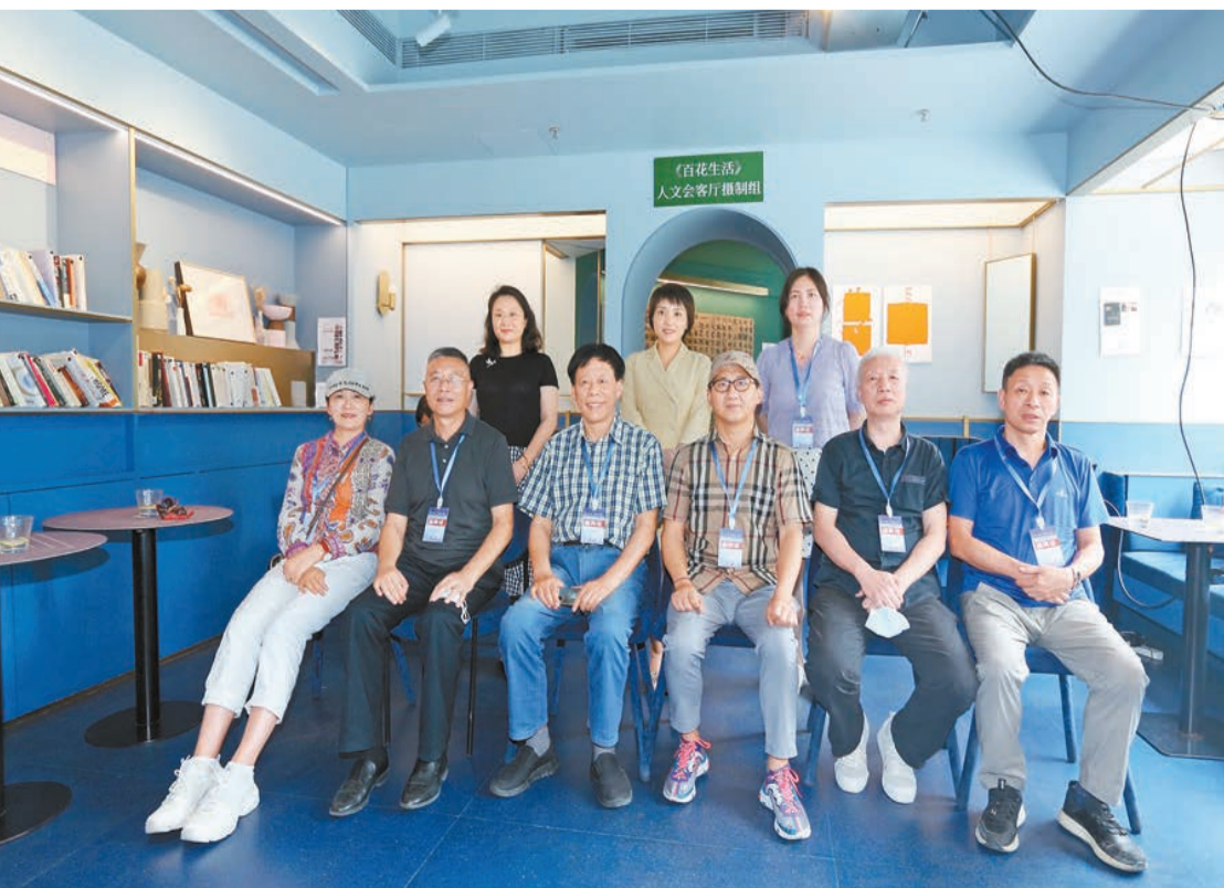
採風團在物質生活書吧合影留念。

廣州市作家協會副主席、廣州市文藝報社原社長鮑十表示，「來到園嶺能感受到一種樸素的「煙火氣」，在忙碌的都市生活中，能夠停下腳步，喝杯咖啡或看一本書，這才是張弛有度的生活。」