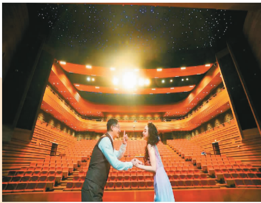
新落成的曹禺剧场排练。

两位老师一起演戏，发现他们手里永远都会拿着一个本子。于是之老师在没有排戏的时候，总是坐在角落，在自己的本子上一直不停地写，把自己对于人物的理解与表演的感受不停地记录下来。而朱旭老师拿着的本子是自己抄录的“剧本”。他认为抄一遍剧本就等于背一遍，所以排练之前，会把剧本一笔画地抄在笔记本上，再将笔记带到排练厅，其他留白的地方则写满对人物的理解、内心潜台词以及一些临场的创作灵感。老一辈艺术家从来不以大师和明星自居，永远把自己作为一名演员，认真对待每一个角色。