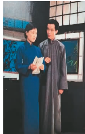
冯远征(右)在《北京人》中饰演曾文清。资料图片

今年是北京人民艺术剧院(以下简称“北京人艺”)建院70周年。从1985年考入北京人艺至今，我在这座剧院度过了37年的时光。从向往舞台的文艺青年，到成为舞台上的一名演员，再到担任演员队长、副院长，一路走来，这座剧院承载了我职业生涯的光荣与梦想，而我也见证了它一代又一代的薪火相传与艺术承启。