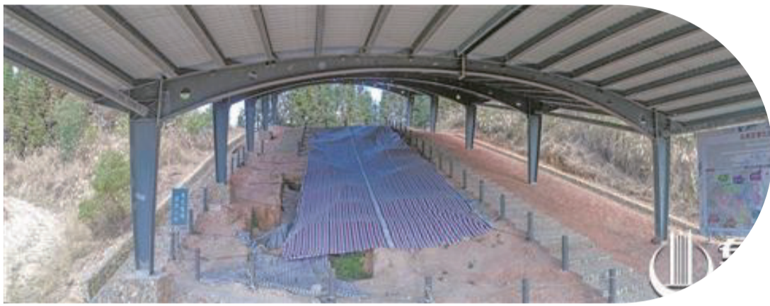
永春苦寨坑原始青瓷窯址