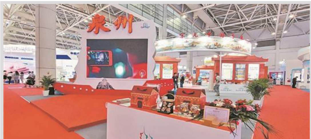
“世遺泉州館”吸引全市48家文旅企業參展

氣之先”。他們將先進的科學技術和思想帶回泉州，從各個方面對泉州社會的發展產生深遠的影響。