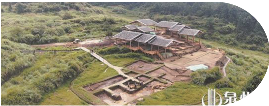
安溪青陽下草埔冶鐵遺址

近日，晉江磁窰系金交椅山窯址列入第二批省級考古遺址公園，南外宗正司遺址、安溪青陽冶鐵遺址作為第二批省級考古遺址公園立項，泉州的省級考古遺址公園數量位居全省前列。