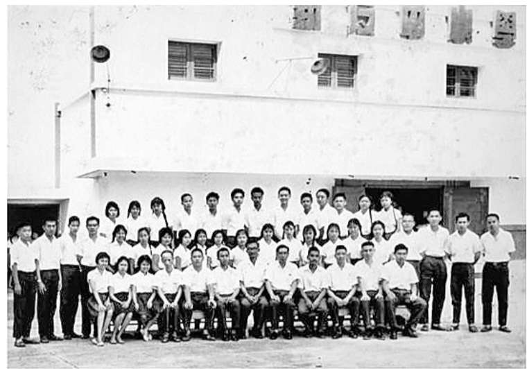
告别母校的最后一张合影