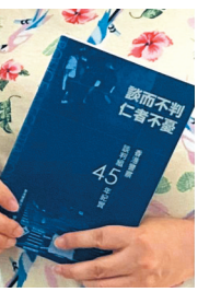
《談而不判, 仁者不憂》書影!