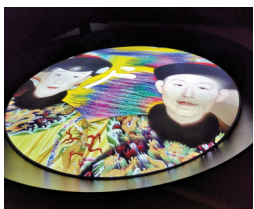
香港故宮內乾隆懷皇后的夢境圖。