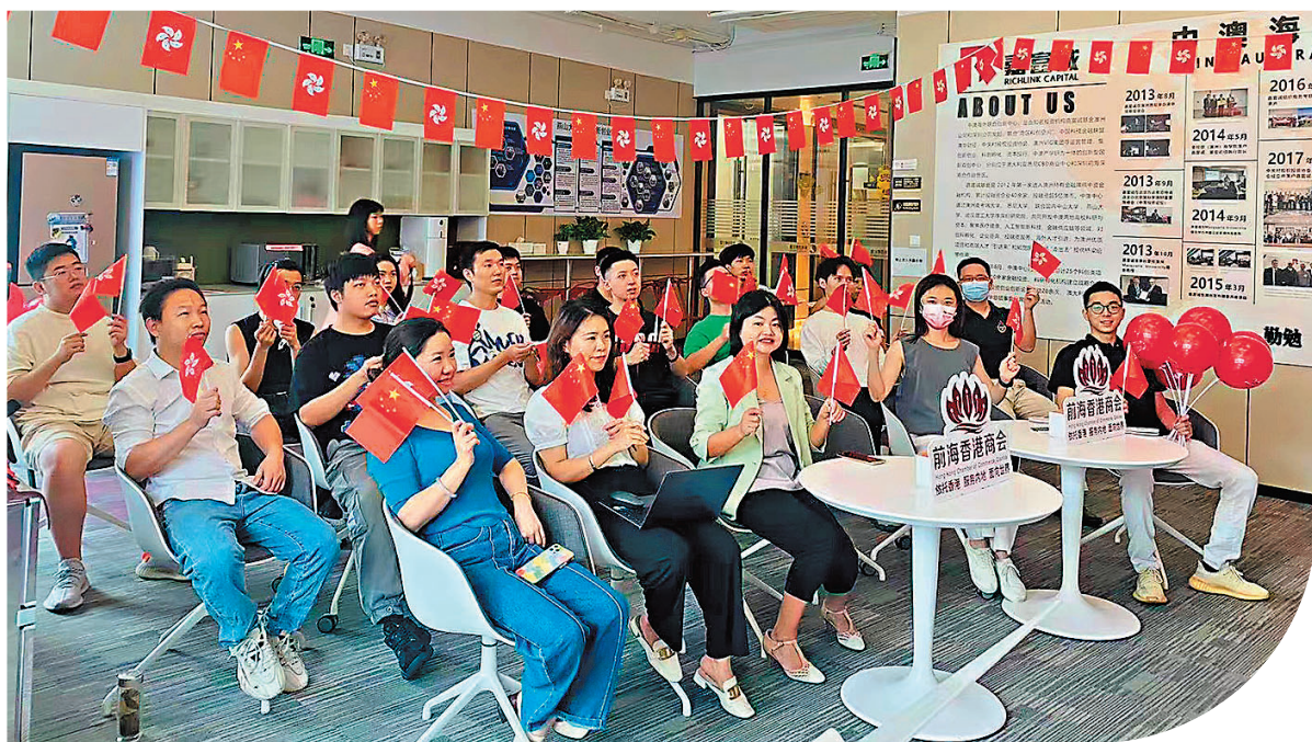
◆前海香港商會日前組織港青觀看慶祝香港回歸祖國25周年大會暨香港特別行政區第六屆政府就職典禮。

香港文匯報訊（記者 郭若溪 深圳報道）7月1日，習近平主席在慶祝香港回歸祖國25周年大會暨香港特別行政區第六屆政府就職典禮上發表重要講話，內地港青、港生通過手機、電視、廣播等平台踴躍收聽、收看慶祝大會盛況。在深圳，香港科創青年、舒糖訊息科技創始人何耀威通過電視直播，全程觀看了慶祝大會和典禮，認真聆聽了習近平主席講話。他表示，習近平主席在講話中提到「香港同內地交流合作領域全面拓展、機制不斷完善，香港同胞創業建國的舞台越來越寬廣」，令他十分感動，備受鼓舞，「這對我們是一種鼓勵，尤其我身在河套地區更有切身感受，政府一直各方面支持我們在內地創業，而且祖國越來越強，給了一個我們無限的發展機遇和信心。」