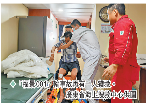
「福景001」輪船事故再有一人獲救。

根據《新型冠狀病毒肺炎防控方案(第九版)》,河北省就疫情防控工作做出最新部署:沒有發生疫情的地區,原則上不開展每周全員預防性核酸篩查;規範風險區劃定流程,確需實施全縣封控管理的,由省總指揮部組織專家研判決定,堅決防止層層加碼現象。