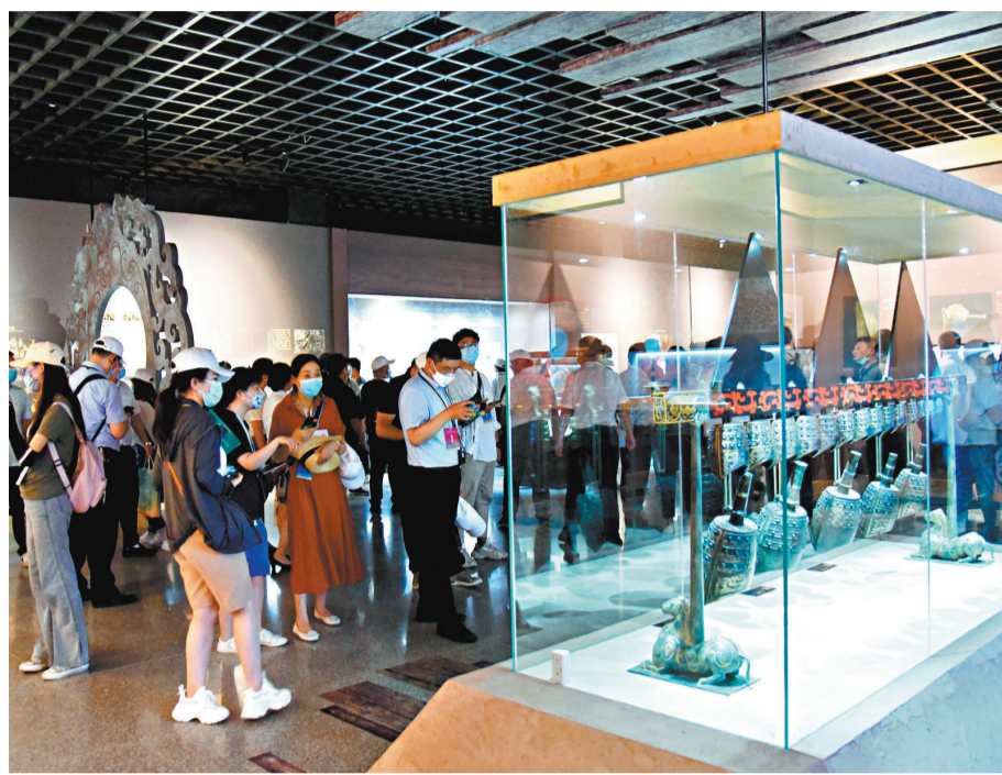
海昏侯文物暑期亮相西安秦皇陵博物院,吸引了眾多遊客。

北京環球度假區的「回歸」還吸引了不少商家的目光,一些圍繞北京環球度假區的跟團遊、旅拍等暑期產品也在熱賣中。業內人士表示,隨着北京學生的暑期臨近,北京環球度假區將進一步助力本地遊的復甦。