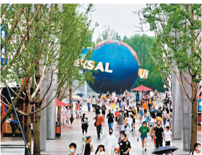
北京環球度假區人氣回升。

香港文匯報訊(記者李陽波、丁樹勇、江鑫燭 西安、雲南、北京連線報道)6月29日,全國行程卡「摘星」的消息一經發布,不僅瞬間帶動了多個旅遊平台的機票和酒店搜索量直線暴漲,同時也引爆了眾多中國民衆的夏季旅遊熱情,許多人在社交媒體平台晒出了自己的「報復性旅遊」計劃。連日來,「摘星」的效果已初步顯現,陝西、北京、雲南等地多景區人氣迅速攀升,「一票難求」、「人車長龍」又再次出現。進入7月以來,隨著暑期的開啟和多重政策利好的釋放,以及中國多省市「文旅消費季」的助力,景區、住宿、出行等領域均開始了強勁反彈,暑期旅遊市場將迎來復甦高潮。