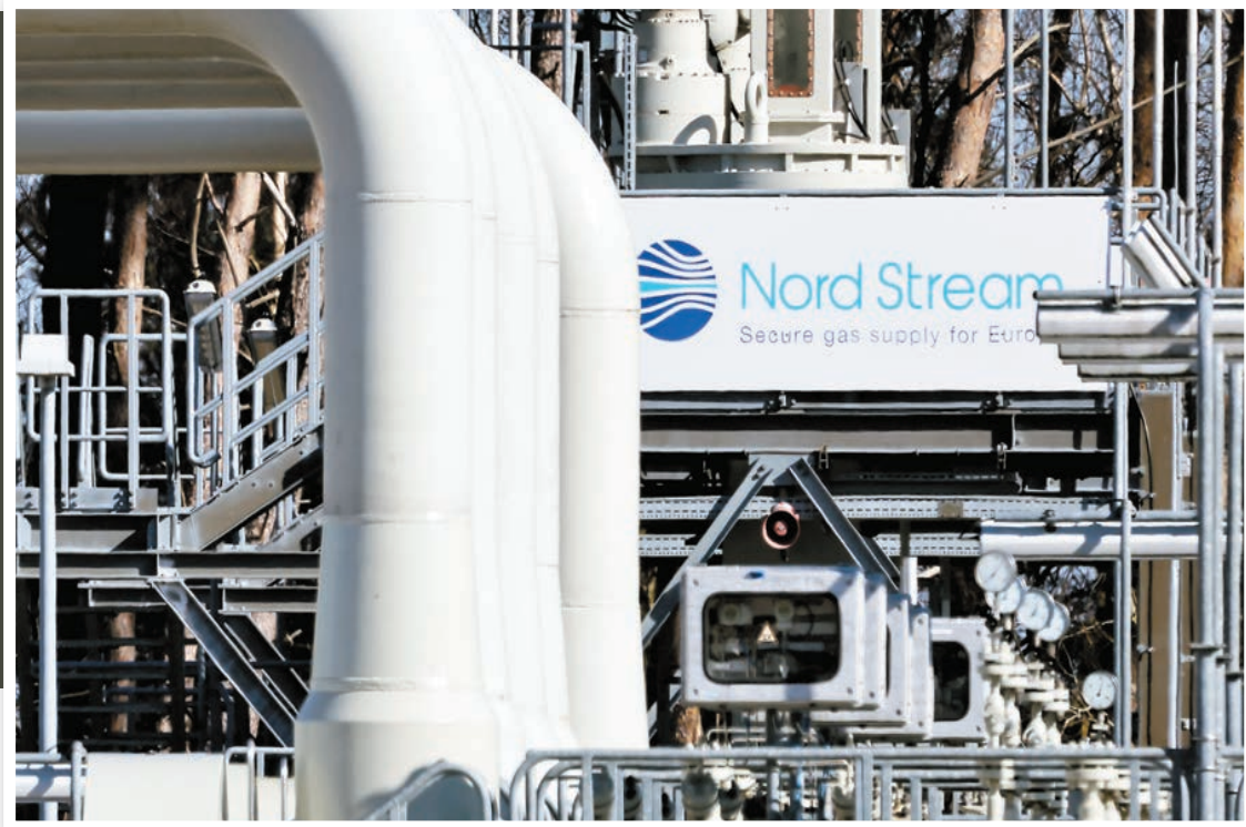
北溪1號是俄羅斯對歐洲主要輸氣管道，關閉管道將加劇歐洲天然氣短缺。

【香港商報訊】據彭博昨天報道，俄羅斯向歐洲供應天然氣的北溪1號天然氣的兩條管道，計劃在本月11日至21日關閉，以進行年度維修。受俄烏衝突影響，為反制西方國家制裁，俄羅斯6月已大幅削減通過北溪管道向歐洲輸送的天然氣量。德國經濟部長哈貝克昨天表示，歐盟有可能準備面對俄羅斯停止向歐盟成員國供應天然氣的可能性。國際能源署署長比羅爾亦警告，俄羅斯可能會完全切斷對歐洲的天然氣供應，歐洲現在需要做好準備。