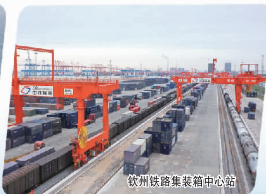
钦州铁路集装箱中心站