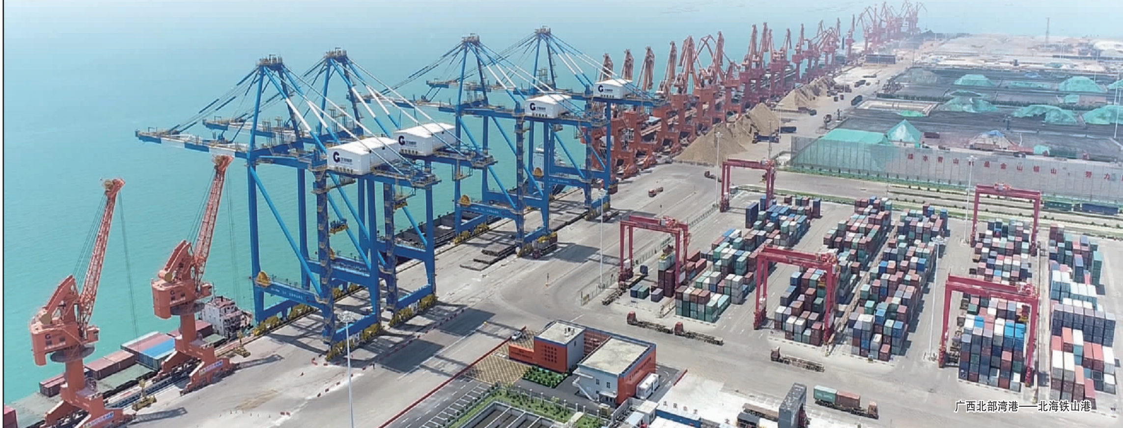
广西北部湾港——北海铁山港