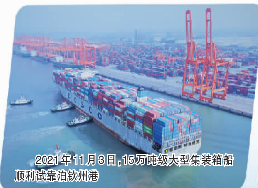
2021年11月3日，15万吨级大型集装箱船顺利试靠泊钦州港