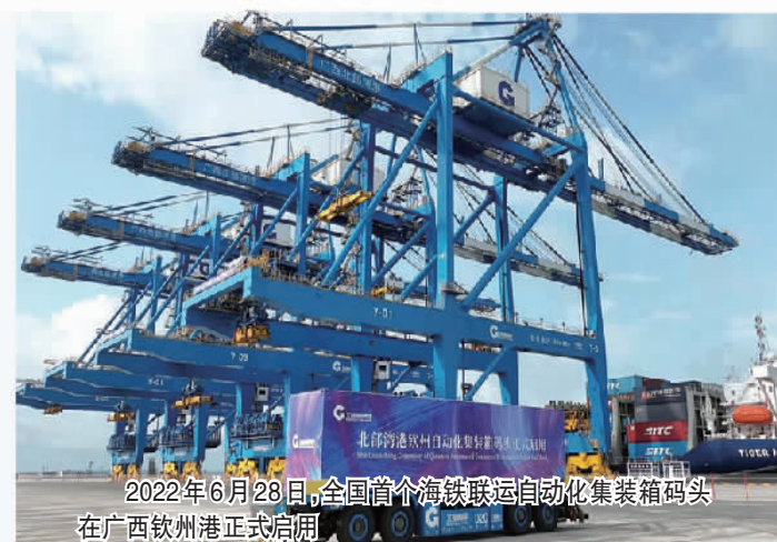
2022年6月28日，全国首个海铁联运自动化集装箱码头在广西钦州港正式启用

广西积极参与“一带一路”建设，抢抓《区域全面经济伙伴关系协定》（RCEP）生效实施机遇，借助泛北论坛这一国际平台，发挥“一湾相挽十一国，良性互动东中西”的独特优势，充分释放发展潜力，向海图强，深度融入泛北部湾区域经济合作，为构建更为紧密的中国—东盟命运共同体积极贡献广西力量。