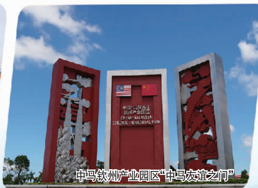
中马钦州产业园区“中马友谊之门”